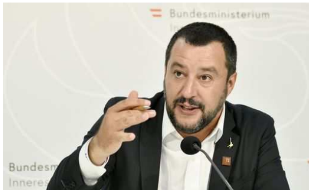
Bruxelles, 25 set. (askanews) - La

Decreto Salvini, fonti Ue: non è del tutto fuori luogo "Ue non regola protezione umanitaria", "bene" aumento espulsioni